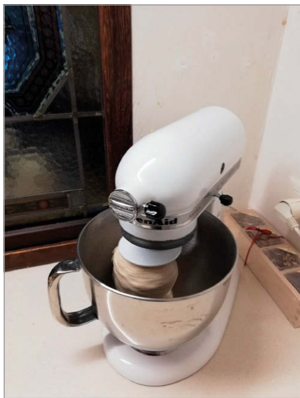
fig. 2. Una delle molte immagini che ritraggono strumenti e fasi del lavoro legate alle attività di panificazione e pasticceria (Marzo 2020. Foto: B.M. Sciré).

essenziali alla stregua di guardare film, serie tv, programmi televisivi e seguire le notizie al telegiornale. Un altro impegno costante è quello nella cura quotidiana di figli o nipoti, nell'aiuto con la didattica a distanza, nella costruzione di attività da fare per riempire le giornate interamente casalinghe. Infine, una parte delle donne ritaglia del tempo per non trascurare di praticare attività fisica. Sono completamente assenti riferimenti di carattere intimo: non vi è alcun rimando al sesso o ai momenti dedicati all'espletamento di bisogni fisiologici; anche nelle descrizioni più dettagliate si sorvola su queste parti della giornata. Gli oggetti riflettono questa assenza: non ci sono ad esempio rimandi al ciclo mestruale (assorbenti, tamponi, slip, ecc.), come del resto non compaiono anticoncezionali, preservativi, carta igienica; un'unica citazione richiama alla presenza di un vibratore.