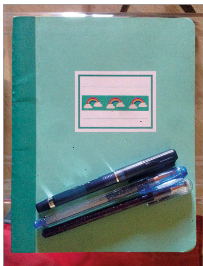
fig. 6. La pratica dello scrivere a mano, su carta, scegliendo con cura penne e matite. (Marzo-aprile 2020.).

non è garanzia di mantenimento, ma al contrario, produttrice di una sovrabbondanza di tracce digitali la cui gestione, in termini di processamento dati, viene trascurata.