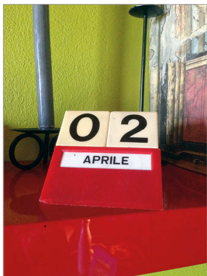
fig. 5. La necessità di marcare il passare di un tempo sospeso attraverso elementi tangibili che visualizzano lo scorrere dei giorni e, allo stesso tempo, interagiscono con lo spazio e la componente umana (Marzo-aprile 2020. Foto: A. Briano).