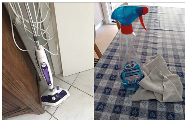
fig. 3. Attrezzi e prodotti dedicati alla pulizia della casa sono ritratti da molte donne come protagonisti delle loro giornate. (Marzo 2020.).

allora che quella che oggi ormai appare come una competenza tecnica acquisita, si rivela, agli inizi del lockdown, come qualcosa di completamente nuovo. I telefoni, fino a quel momento usati essenzialmente per telefonare, scambiare messaggi, interagire all'interno dei social media, ascoltare musica, scattare fotografie, acquisiscono queste loro funzionalità e ne acquisiscono di nuove. Questi oggetti diventano essenziali per vincere l'isolamento, ma anche per garantire la formazione e il lavoro.